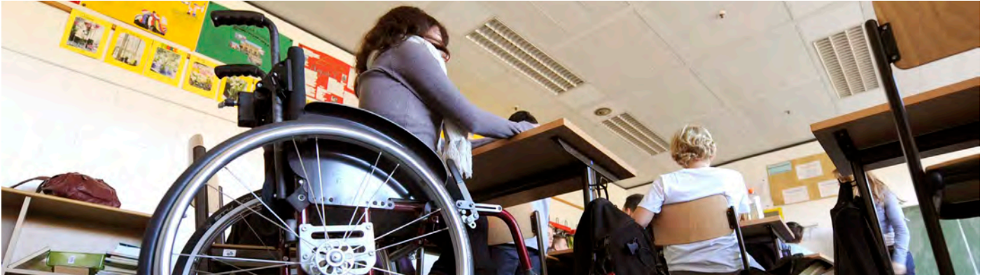
Kinder mit und ohne Behinderung sollen gemeinsam in den öffentlichen Schulen unterrichtet werden.