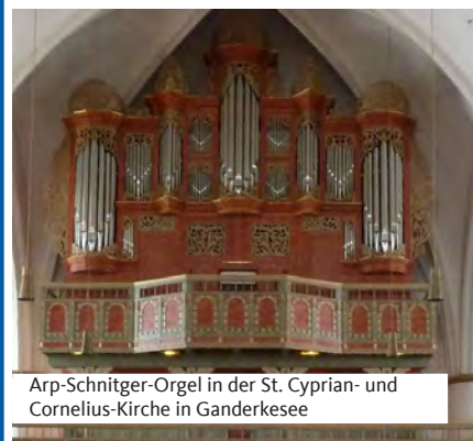
Arp-Schnitger-Orgel in der St. Cyprian- und Cornelius-Kirche in Ganderkesee