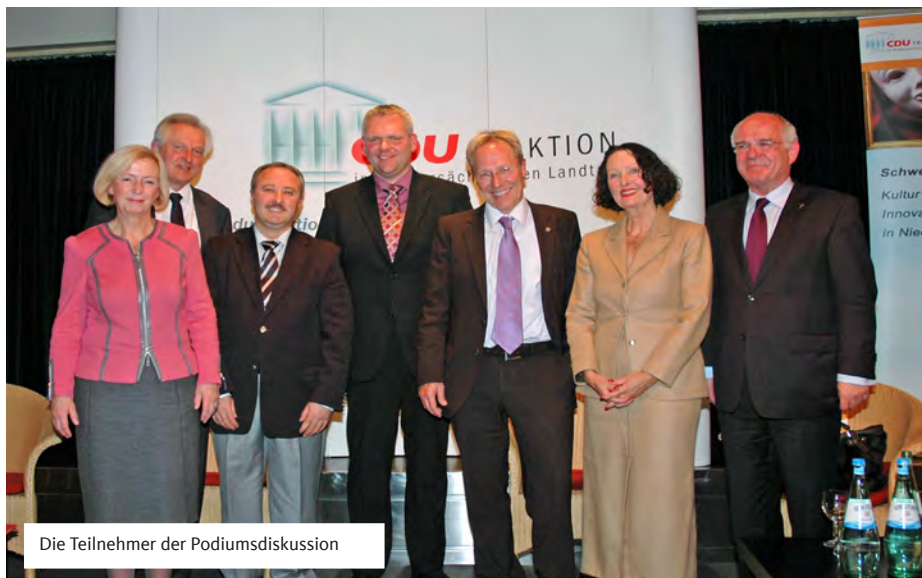
Die Teilnehmer der Podiumsdiskussion