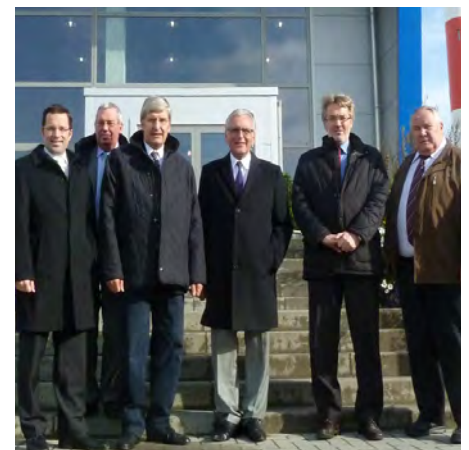
Die Hafenpolitischen Sprecher in Wilhelmshaven

Einig war man sich darin, eine Neuaufgabe des ‚Port Package‘ abzulehnen. „Eine zu strenge Konzessionsregulierung ist Gift für die Leistungsfähigkeit der Seehäfen“, machte Hiebing deutlich. Von diesen realitätsfernen Vorstellungen sollte man sich in Brüssel verabschieden.