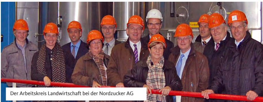
Der Arbeitskreis Landwirtschaft bei der Nordzucker AG

würden mit Zöllen belegt. „Beide Instrumente sind bis heute für das Funktionieren der Marktordnung unverzichtbar“, so Große Macke. Sie sollten vor allem sicherstellen, dass der EU-Binnenmarktpreis nicht unter ein bestimmtes Preisniveau absinkt, um die Rentabilität des Rübenanbaus und der Zuckererzeugung in der EU zu erhalten. Ein Ausstieg sei daher nicht vertretbar. „In einer parlamentarischen Initiative haben wir deshalb die Landesregierung gebeten, sich für den Erhalt der Zuckermarktordnung bis zum Jahr 2020 einzusetzen“, betonte Große Macke. „Wir wissen um den wichtigen Beitrag des Agrarsektors im ländlichen Raum für Einkommen und Beschäftigung.“